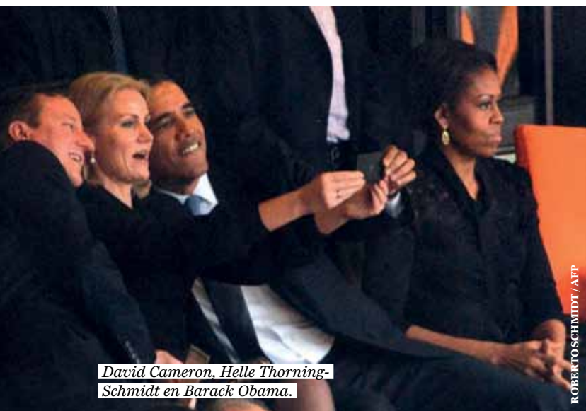
David Cameron, Helle Thorning-Schmidt en Barack Obama.