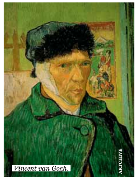
Vincent van Gogh.

niet zonder gevaar. 'Maak in ieder geval dat je heel, heel, heel zeker weet dat die spiegels niet naar beneden donderen als je daar onder in bed ligt', zo lazen we deze week nog op een handig zelfhulpforum. 'Scherven in je buik geven een heel andere dimensie aan SM.'