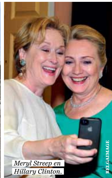
Meryl Streep en Hillary Clinton.