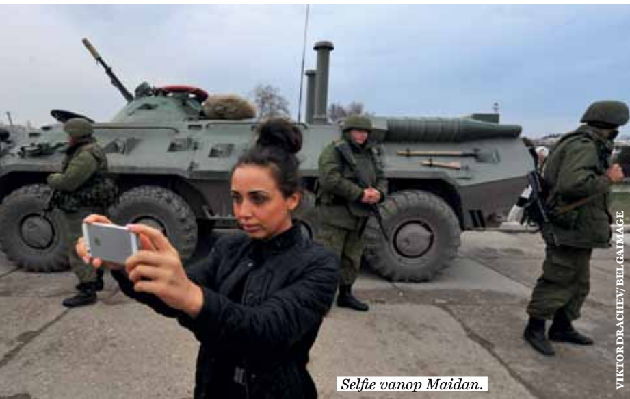
Selfie vanop Maidan.